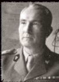
Antoni Chruściel ps. „Monter”

ur. 16 czerwca 1895r., generał brygady Wojska Polskiego, komendant Okręgu Warszawa ZWŻ/AK