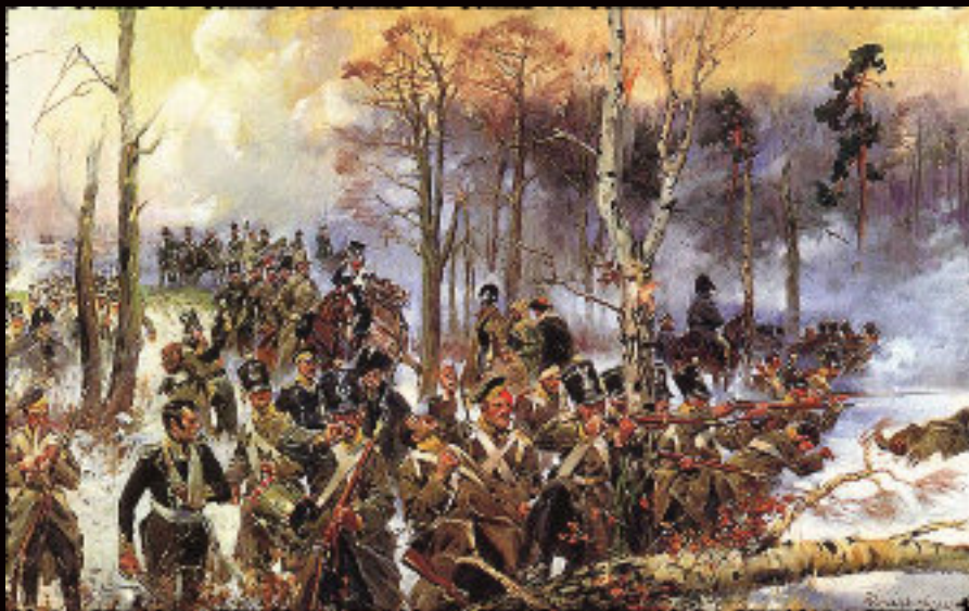
(obraz Wojciecha Kossaka "Bitwa Pod Olszynką Grochowską" w zbiorach Muzeum Narodowego w Warszawie)

Po bitwie pod Wawrem wojska rosyjskie pod dowództwem gen. Dybicza zaczęły atak na Grochów i Białołękę. Na teren walnej bitwy dowodzący polskimi wojskami gen. Chłopicki wybrał bagnistą dolinę między Pragę, Wawrem, Kawęczynem a Ząbkami. Po stronie rosyjskiej było ok. 65 000 żołnierzy i 228 dział, po stronie polskiej ok. 50 000 żołnierzy i 136 dział.